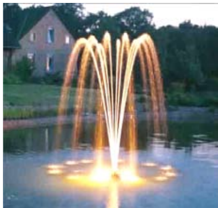
6 - Greve Golfklub