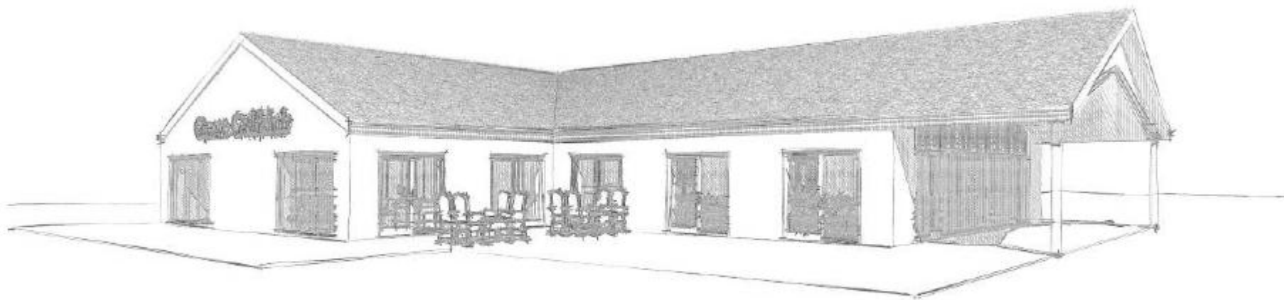
Klubhus set fra 1. tee