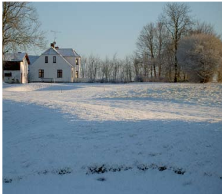
Billedet er fra den forgangne vinter ...