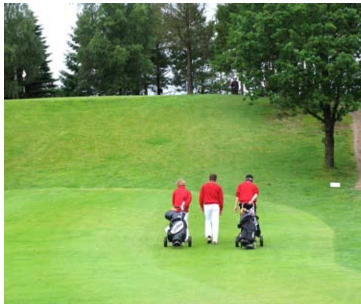
Landets bedste golfspillere under 19 år spiller på Greve Golf den 3. og 4. maj. Greve Golfklub - 7

De kommende turneringer spilles i Sæby og Herning, og finaleturneringen afvikles på Støvringgaardbanen i Randers.