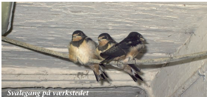
Svalegang på værkstedet

Vi kan stadigvæk bruge flittige hænder og kreative hjerner i forbindelse med planlægningen og udførelsen af kommende arrangementer, så skriv jer gerne på listen på opslagstavlen i klubhuset.